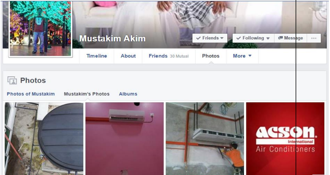
Caption : Facebook milik beliau ialah 'Mustakim Akim'

iv) Lain-lain (contoh : proses penghasilan produk, penglibatan dalam aktiviti lain, dsb)