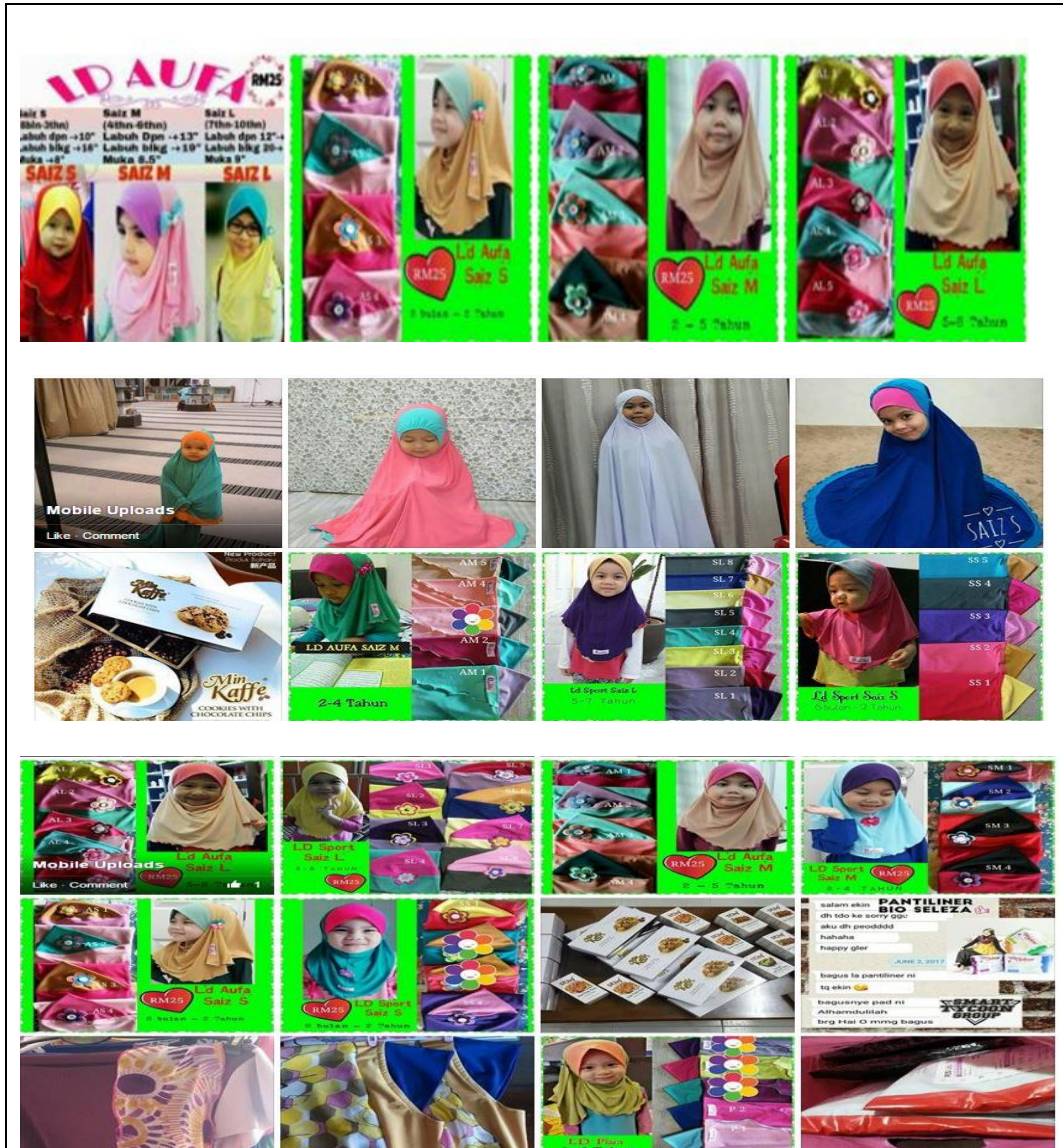
Caption : Antara koleksi tudung,telekung dan barangan lain yang di jual oleh Puan Nursuhaibah